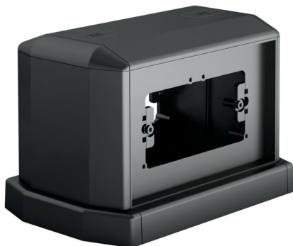
IMMAGINE RAPPRESENTATIVA REPRESENTATIVE IMAGE